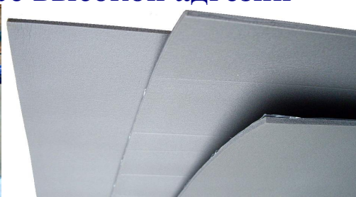
Isolontape 500 маты