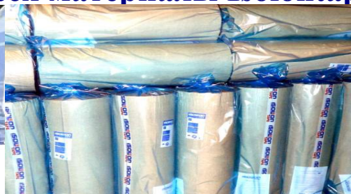
Isolontape 500 рулоны